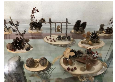
自然の家の作品例